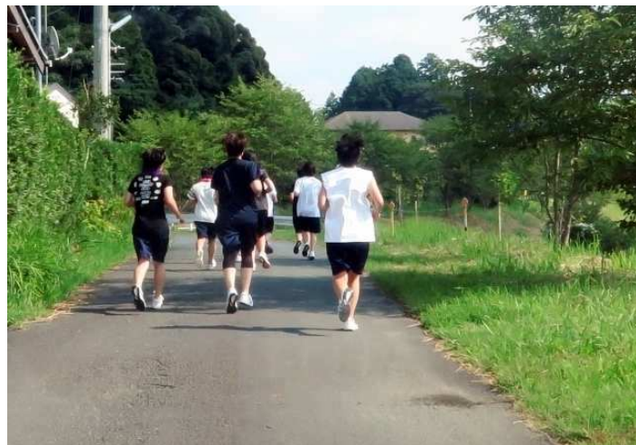
画像はイメージ

部活動改革はいま、ようやくその成果が見え始めてきた。世の中は、変わる。部活動改革に関心をもってきた一人として、エビデンス（科学的根拠）を用いてこのような記事を書ける日が来たことを、本当にうれしく思う。この成果をみんなで共有しながら、今後の改革推進の糧としていきたい。