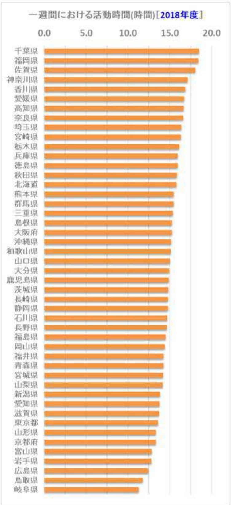
都道府県別の一週間における活動時間数とその順位 (左図：2017年度、右図：2018年度) ※スポーツ庁の調査結果をもとに筆者が算出・作図